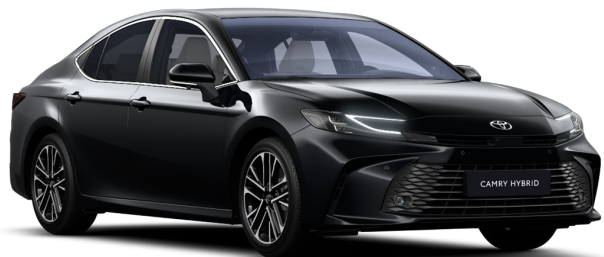
Чёрный металлик (218)