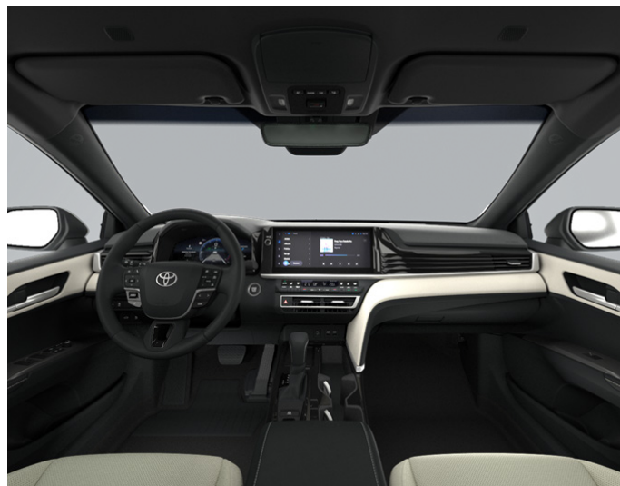
Кожа белого цвета (LA00) Комплектации "Престиж" и "Люкс"