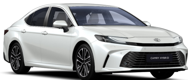
Белый жемчуг премиум (089)