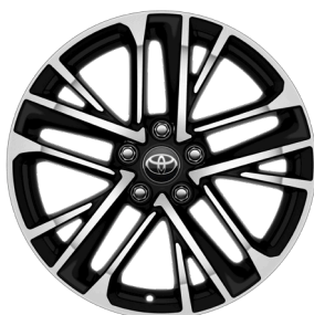
Легкосплавные диски 18" Комплектации "Престиж" и "Люкс"