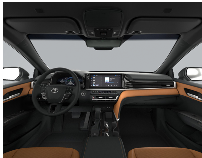
Кожа коричневого цвета (LA41) Комплектации "Престиж" и "Люкс"