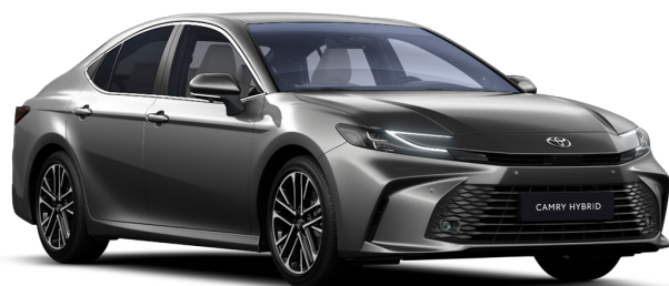
Серебристый премиум (1L5)