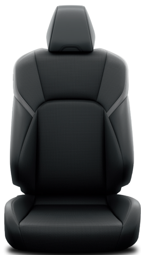
Кожа чёрного цвета (LA20) Комплектации "Престиж" и "Люкс"