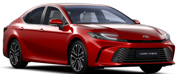
Красный премиум (3U9)