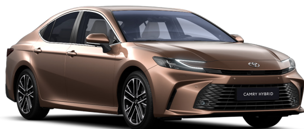
Бронзовый металлик (4Y6)