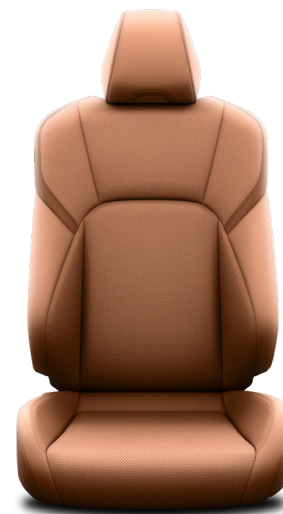
Кожа коричневого цвета (LA41) Комплектации "Престиж" и "Люкс"