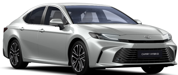
Серебристый металлик (1F7)