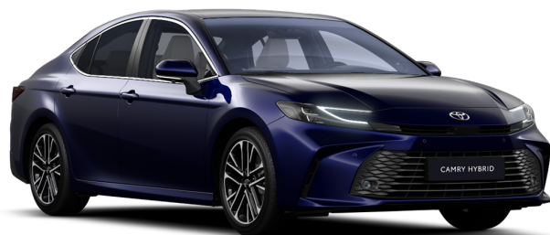
Тёмно-синий металлик (8X8)