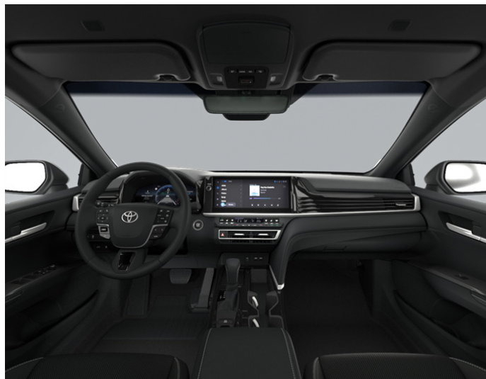
Кожа чёрного цвета (LA20) Комплектации "Престиж" и "Люкс"