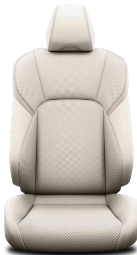
Кожа белого цвета (LA00) Комплектации "Престиж" и "Люкс"