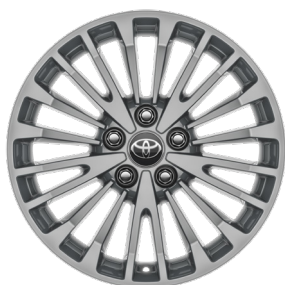
Легкосплавные диски 17" Комплектация "Элеганс"