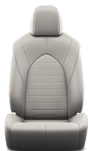
Кожа серого цвета (EB10) Комплектация "Комфорт"