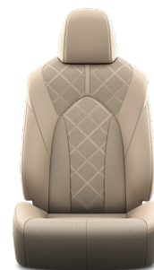
Кожа бежевого цвета (LA40) Комплектация "Люкс"