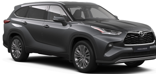
Тёмно-серый металлик (1G3)