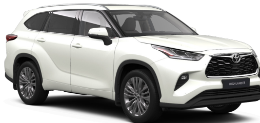
Белый жемчуг премиум (089)