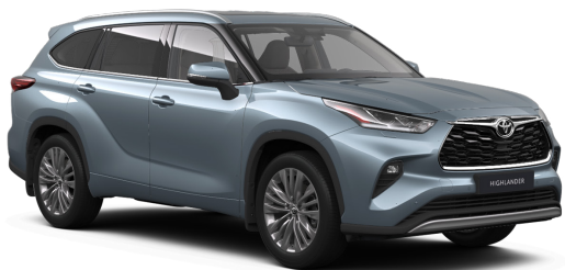
Серо-голубой премиум (1K5)