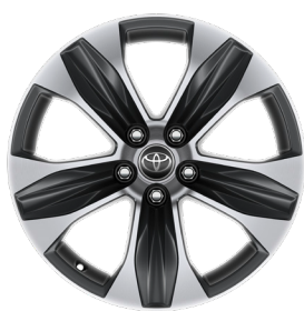
Легкосплавные диски 18" Комплектация "Престиж"