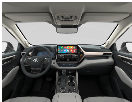
Кожа серого цвета (LA10) Комплектация "Люкс"