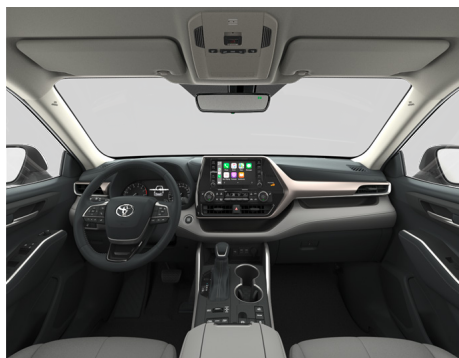
Кожа серого цвета (EB10) Комплектация "Престиж"