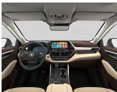
Кожа бежевого цвета (LA40) Комплектация "Люкс"