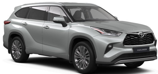
Серебристый металлик (1J9)