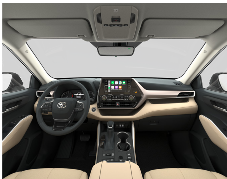
Кожа бежевого цвета (EB40) Комплектация "Престиж"