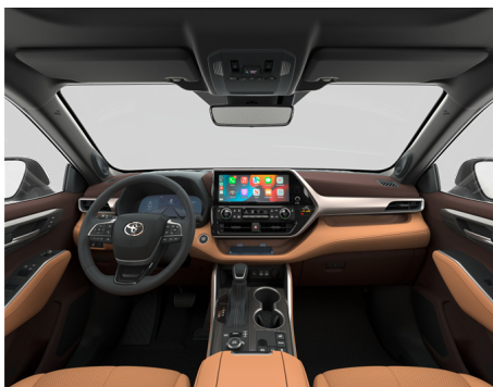
Кожа цвета Охра (LA41) Комплектация "Люкс"