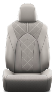
Кожа серого цвета (LA10) Комплектация "Люкс"