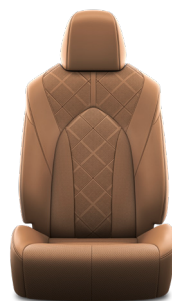
Кожа цвета Охра (LA41) Комплектация "Люкс"