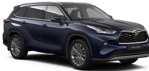
Тёмно-синий металлик (8X8)