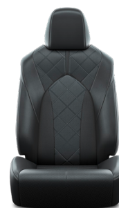
Кожа чёрного цвета (LA20) Комплектация "Люкс"