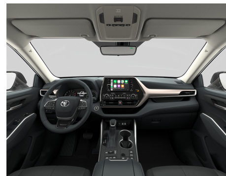
Кожа чёрного цвета (EB20) Комплектация "Престиж"