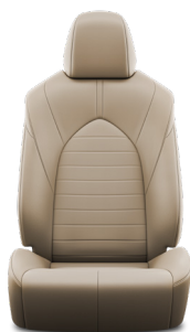
Кожа бежевого цвета (EB40) Комплектация "Комфорт"