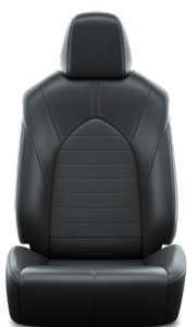
Кожа чёрного цвета (EB20) Комплектация "Комфорт"