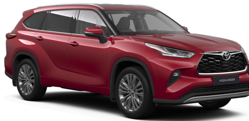
Красный премиум (3T3)