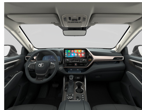
Кожа чёрного цвета (LA20) Комплектация "Люкс"