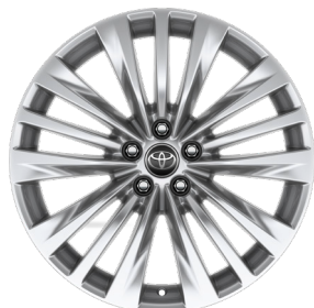
Легкосплавные диски 20" Комплектация "Люкс"