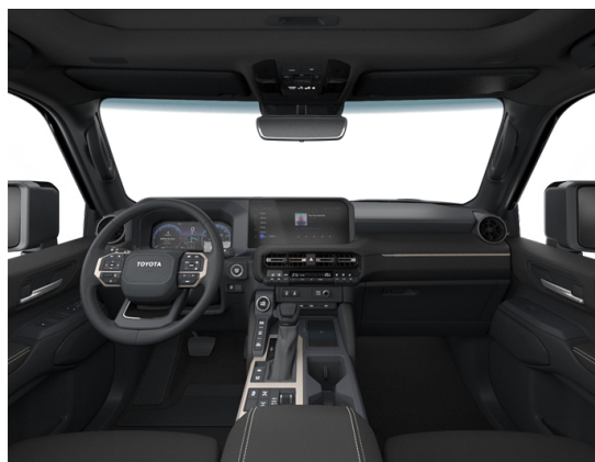
Искусственная кожа чёрного цвета (EB20) Комплектация "Престиж"