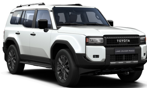
Белый жемчуг (089)