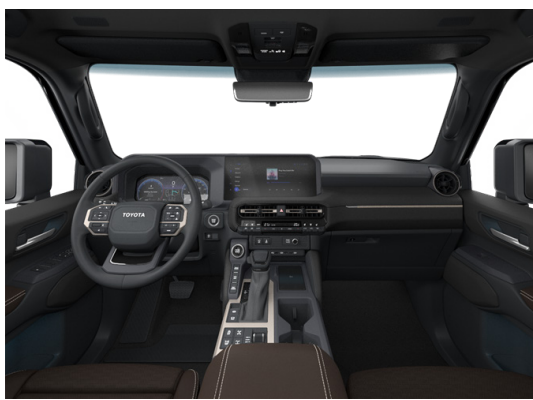
Кожа тёмно-каштанового цвета (LB40) Комплектации "Люкс" и "Люкс+"