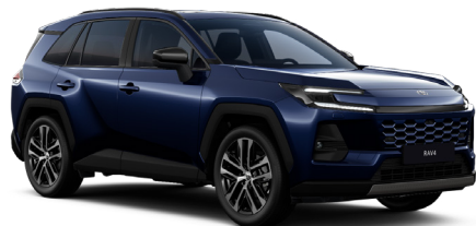
Тёмно-синий металлик (8X8)