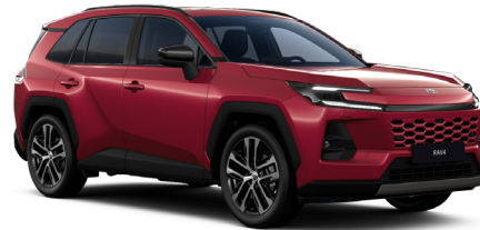
Красный металлик (3T3)