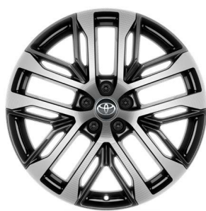
Легкосплавные диски 20" Комплектация "Люкс"