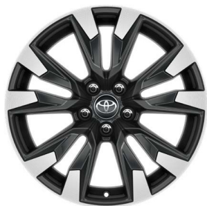
Легкосплавные диски 18" Комплектации "Комфорт", "Престиж"