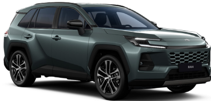
Зелёный металлик (6X7)